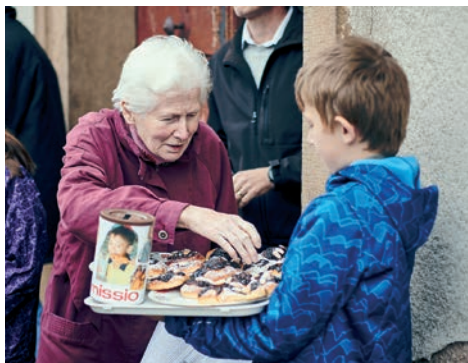
Misijní koláč je v mnoha farnostech neodmyslitelnou součástí oslav Misijní neděle

Na tento úmysl můžeme věnovat modlitbu růžence nebo jakoukoliv jinou modlitbu za misie, stejně tak své utrpení, skutky lásky nebo čas osobní modlitby. Radost ze spojení s Bohem tak předáme do mnoha potřebných míst světa.