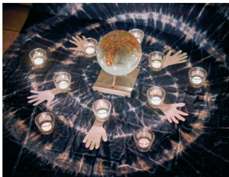
Společný misijní modlitební večer můžete pojmout velmi kreativně a přizvat si na pomoc děti

Misijní činnost každého křesťana je odpovědí na trvalý Ježíšův příkaz: „Jděte do celého světa a hlásejte evangelium všemu tvorstvu.“ (Mk 16,15) Jediným motivem misijní činnosti má být poselství a láska Pána Ježíše, šířené svatostí vlastního života a dobrými skutky. Papež František klade opět důraz na tento úkol a vybízí nás slovy „ Vykročme s hořícím srdcem “ (srov. Lk 24, 13-35).