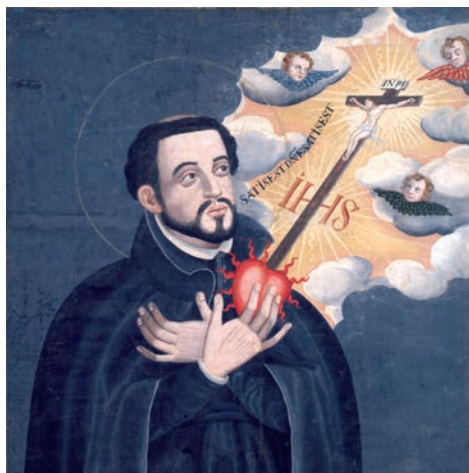
František Xavérský byl prvním misionářem v Japonsku