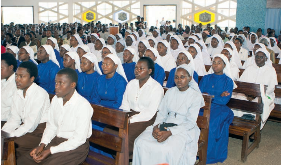
Papežské misijní dílo sv. Petra apoštola se stará také o to, aby katolická církev měla dostatek řeholního dorostu