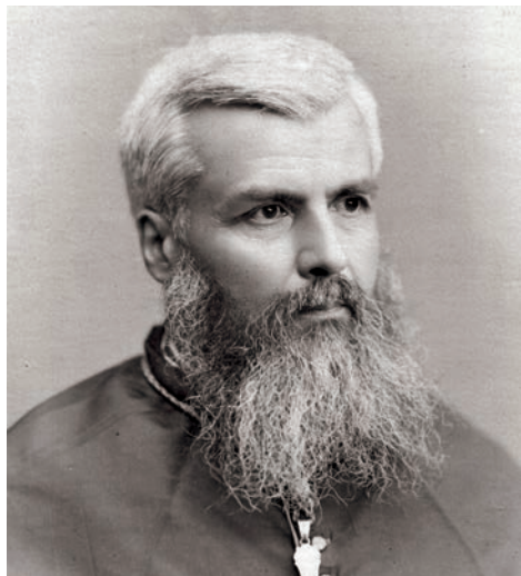
Jules-Alphonse Cousin, biskup v Nagasaki

Velkorysost jejich darů neušla biskupovi v Nagasaki Julesovi-Alphonse Cousinovi, který se na obě ženy v červnu 1889 obrátil s prosbou o podporu semináře pro místní kněze. Jeanne považuje dopis za paprsek světla, který jí osvětlil a vytyčil další cestu. Snaží se zvýšit podporu Japonsku, ale zároveň si uvědomuje, že by chtěla rozšířit okruh příjemců podpory. Od misionářů ze všech oblastí v Indii, Indočíně, Mandžusku i Africe dostávají stejnou zprávu, že budoucnost misí závisí na formaci