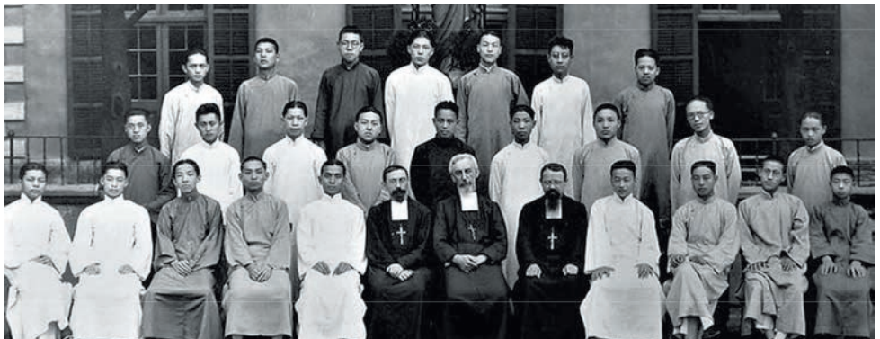
Snímek z roku 1902 zachycuje japonské seminaristy a jejich formátory 13 let od založení Díla sv. Petra apoštola

Když Dílo SPA vzniklo, Jeanne Bigard cestovala po všech francouzských diecézích, aby o něm zvýšila povědomí a povzbudila věřící, aby štědře přispívali modlitbami a obětmi na vzdělávání místních duchovních v misijních zemích. Dnes musí být toto dílo prioritou každé národní kanceláře, která má vyvíjet