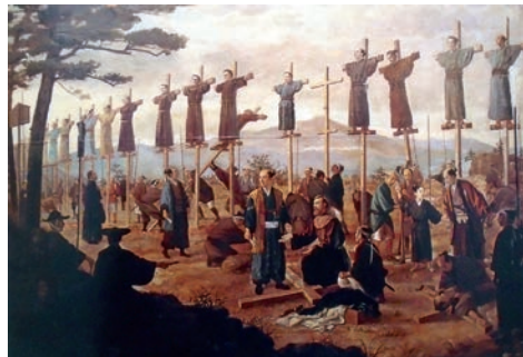
Křesťanští mučedníci v Japonsku v 17. století