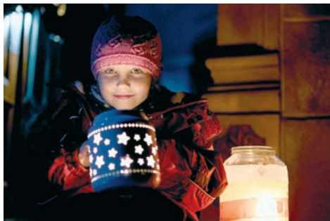
Misijní most modlitby lze spojit s noční hrou