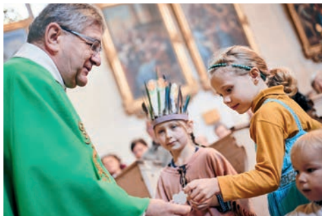
Obětní průvod během Misijní neděle