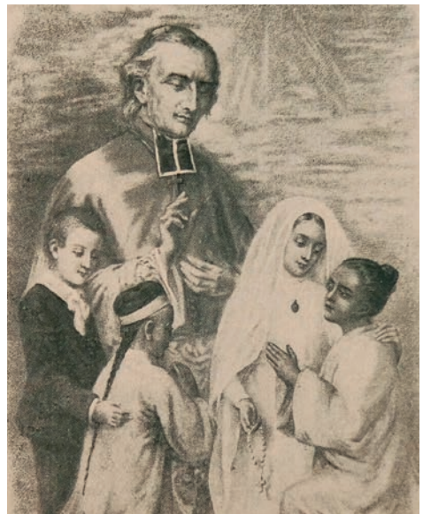
...zakladatel Misijního díla dětí