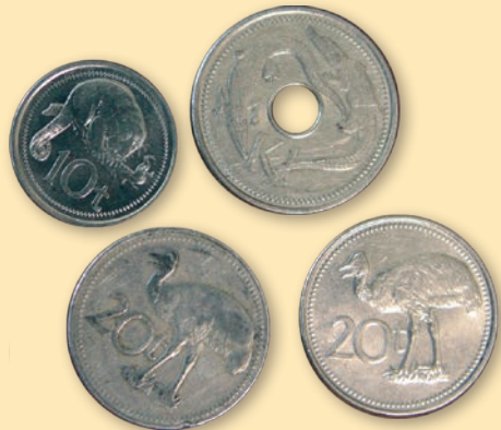
Papuánské drobné mince