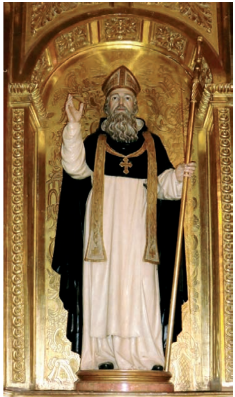
Sv. Jeroným Hermosilla