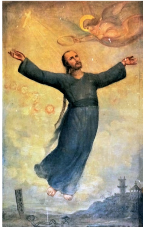
Obraz představující nanebevzetí misionáře Jeana-Gabrie-la Perboyra

V roce 1839 zastínily obzor dvě zdánlivě nesouvisející události. První bylo vypuknutí pronásledování poté, co mandžuský císař Quinlong v roce 1794 zakázal křesťanské náboženství. Druhou bylo vypuknutí čínsko-britské války. Ta nakonec trvala tři roky a je označována jako „opiová válka“.