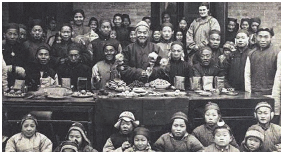
Komunita čínských křesťanů zachycená na fotografii z roku 1905 při slavení Vánoc