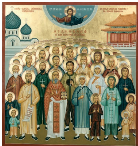
Čínští křesťanští mučedníci

Jean-Gabriel se po období aklimatizace v portugalské kolonii Macao vydal na dlouhou cestu džunkou, pěšky nebo na koni, která ho po osmi měsících zavedla do Nanyangu, kde začal znovu studovat jazyk. Před začátkem misijního působení se musel nejen zdokonalovat v čínštině, ale také přizpůsobit svůj zevnějšek. Vstup do země byl Evropanům zakázán a bylo