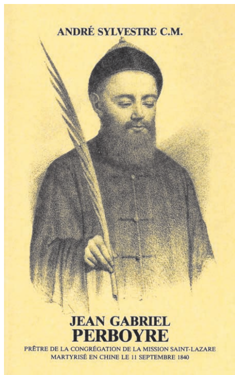
Život a mučednická smrt Jeana-Gabriela Perboyra se stala předlohou pro mnoho textů