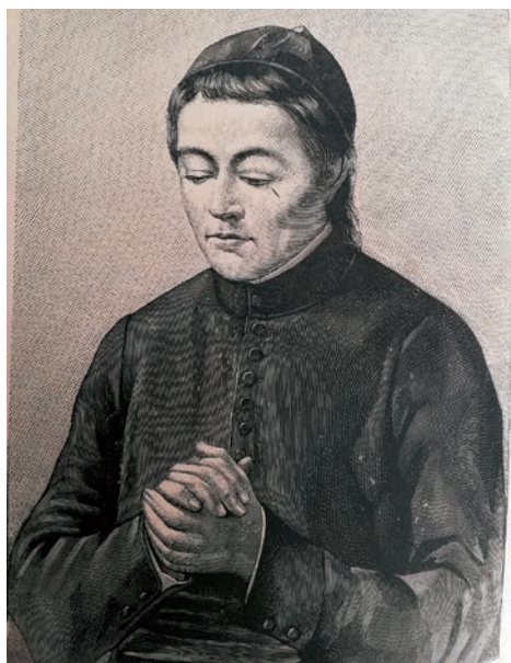
Mladý Jean-Gabriel Perboyre před odjezdem do Číny

Pro mladého Perboyra ale bylo přirozené, že si vybral misijní kongregaci, kterou založil svatý Vincenc de Paul v roce 1625, aby